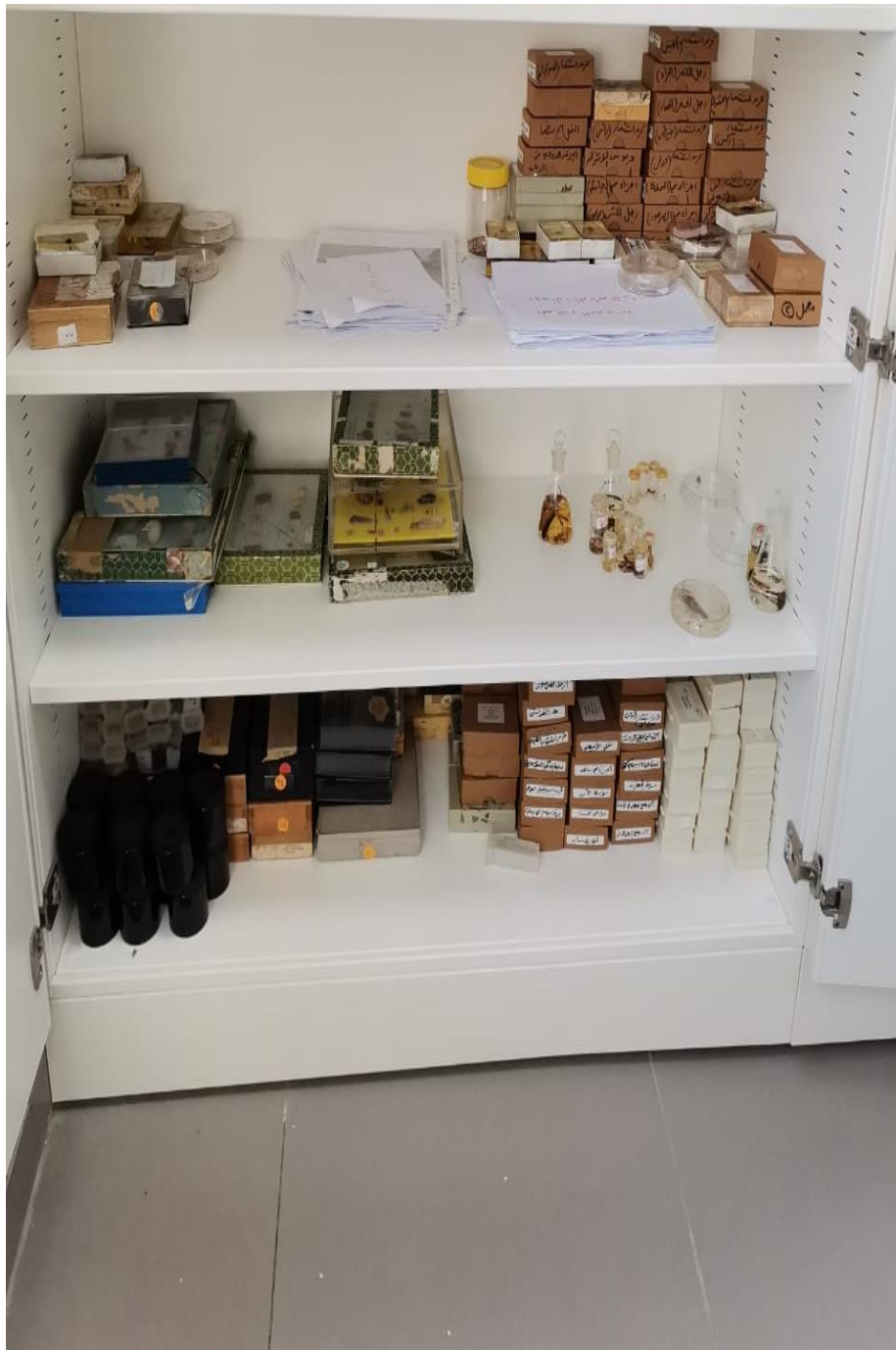
عينات حشرات (Insect Samples)