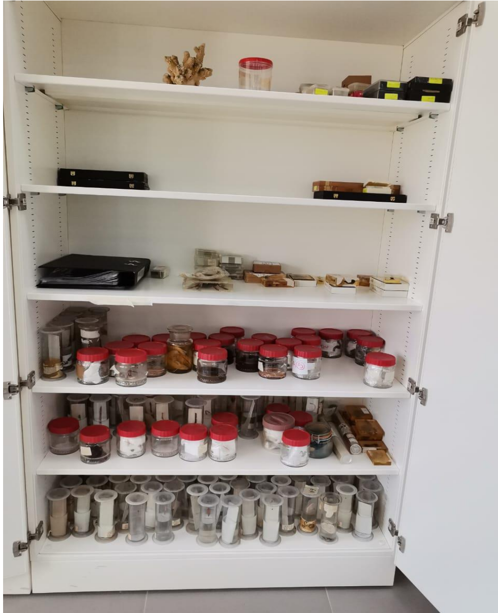
عينات لافقاريات (Invertebrate Samples)