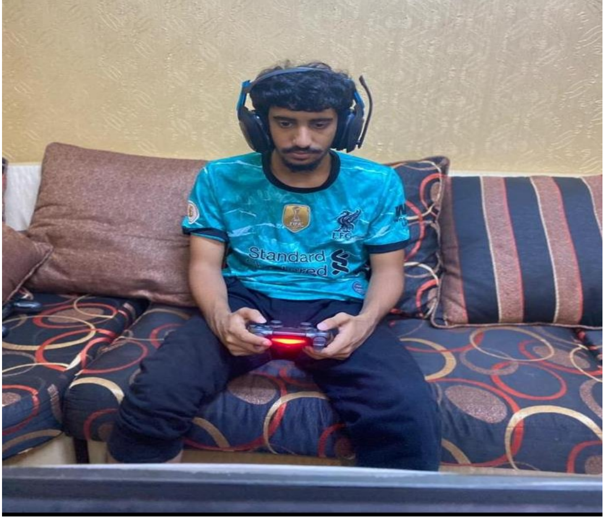
بطولة الجامعة لكرة الطائرة الشاطئية